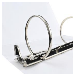
Arillo en O de 3