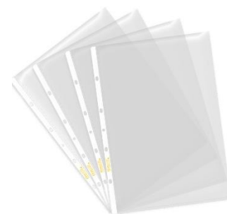
Protectores de hoja